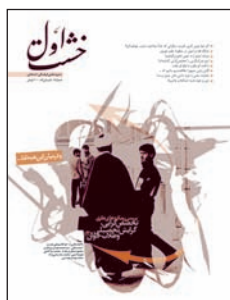
۷. بررسی رویکردهای نظری تخصص‌گرایی، گرایش تحصیلی و طالاب جوان (۱)